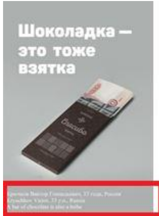
علبة الشوكولاته - هي أيضا رشوة! (ملصق)